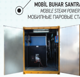
MOBİL BUHAR SANTRALLERİ MOBILE STEAM POWER PLANTS МОБИЛЬНЫЕ ПАРОВЫЕ СТАНЦИИ