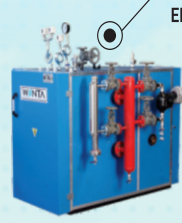
ELEKTRİK MEKATRONİK BUHAR JENERATÖRLERİ ELECTRICAL MECATRONIC STEAM GENERATORS ЭЛЕКТРИЧЕСКИЕ ПАРОГЕНЕРАТОРЫ