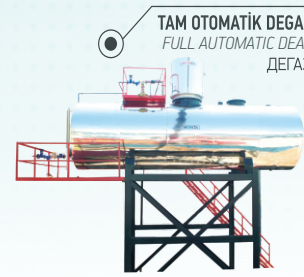
TAM OTOMATİK DEGAZÖRLER FULL AUTOMATIC DEGAZATOR ДЕГАЗАТОРЫ