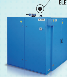
ELEKTRİK KALORİFER KAZANLARI ELECTRICAL HEATING BOILERS ЭЛЕКТРИЧЕСКИЕ ОТОПИТЕЛЬНЫЕ КОТЛЫ