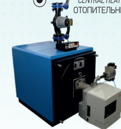
KALORİFER KAZANLARI CENTRAL HEATING BOILERS ОТОПИТЕЛЬНЫЕ КОТЛЫ