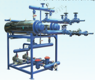
FUEL OIL POMPALAMA İSTASYONU FUEL OIL PUMPING STATION МАЗУТО-НАСОСНАЯ СТАНЦИЯ