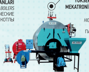
YÜKSEK BASINÇLI KATI YAKITLI MEKATRONİK KENDİNDEN STOKERLİ BUHAR KAZANLARI HIGH PRESSURE STEAM BOILERS WITH SOLID FUEL ПАРОВЫЕ КОТЛЫ СО СТОКОМ НА ТВЕРДОМ ТОПЛИВЕ