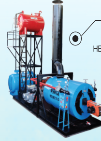
KIZGIN YAĞ KAZANLARI THERMAL OIL BOILERS НЕФТЬ КОТЛЫ ВОРОЖЕЙ