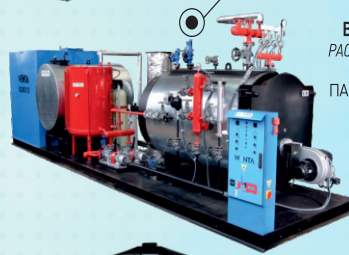
ŞASE ÜSTÜ PAKET BUHAR KAZANLARI PACKAGE STEAM BOILERS ON CHASSIS ПАКЕТНЫЕ ПАРОВЫЕ КОТЛЫ НА ШАССИ/АЗЕМЛЕН ПАКЕТ