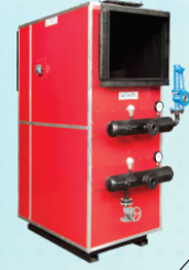
EKONOMİZER ECONOMIZER ЭКОНОМІЗЕР