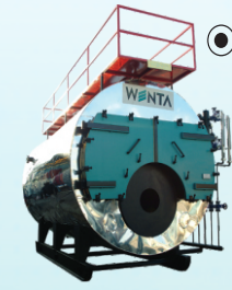
YÜKSEK BASINÇLI BUHAR VE KIZGIN SU KAZANLARI HIGH PRESSURE STEAM AND SUPER HEATED WATER BOILERS ВОДОГРЕЙНЫЕ КОТЛЫ