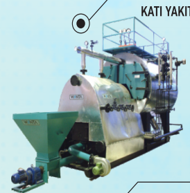
KATI YAKITLI STOKERLİ ÖN OCAKLI BUHAR KAZANLARI STEAM BOILERS WITH FRONT FURNACE ПАРОВЫЕ КОТЛЫ С ФРОНТАЛЬНОЙ ТОПКО