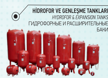
HİDROFOR VE GENLEŞME TANKLARI HYDROFOR & EXPANSION TANKS ГИДРОФОРНЫЕ И РАСШИРИТЕЛЬНЫЕ БАКИ