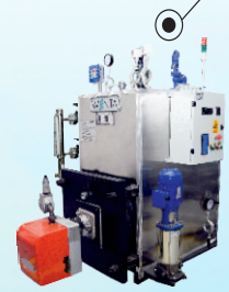
MEKATRONİK BUHAR JENERATÖRLERİ MECATRONIC STEAM GENERATORS ПАРОВЫЕ ГЕНЕРАТОРЫ